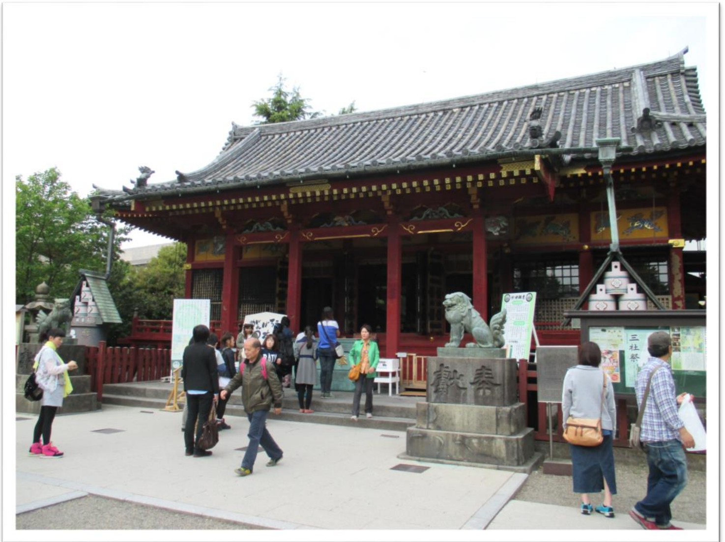
あさくさじんじや 浅草神社 (Asakusa Shrine)

ガイドブックに載っていない浅草の素敵なおところはまだまだたくさんあります。知りたいですか？ぜひ人力車に乗ってください！