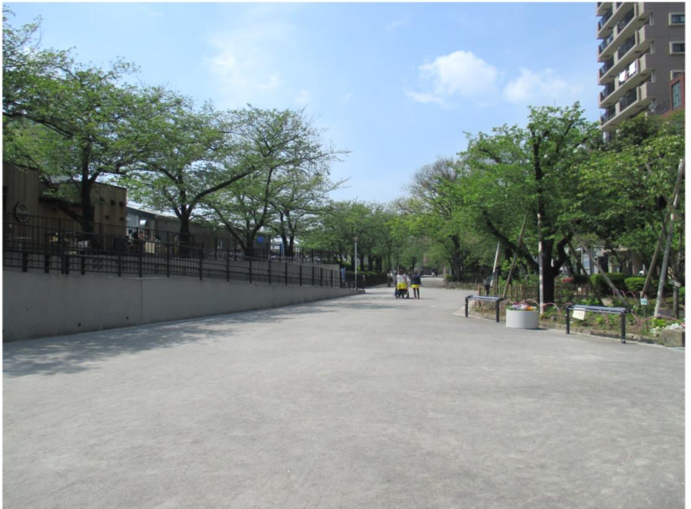
すみだこうえん 隅田公園 (Sumida Park)